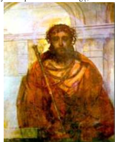
Namalowany przez Adama Chmielowskiego obraz „Ecce Homo”

Adam Chmielowski (1845 – 1916) urodził się w Igołomii pod Krakowem. Wczesnie stracił rodziców. Gdy miał 18 lat, wziął udział w powstaniu styczniowym. Ciężko ranny, dostał się do niewoli rosyjskiej. W prymitywnych warunkach polowych, bez środków znieczulających amputowano mu nogę, co zniósł niezwykle mężnie. Aby uniknąć represji władz carskich, wyjechał do Paryża, gdzie podjął studia malarskie. Potem przeniósł się do Belgii i studiował inżynierię, lecz powrócił wkrótce do malarstwa i ukończył Akademię Sztuk Pięknych w Monachium. Wszędzie, gdzie przebywał, wyróżniał się postawą chrześcijańską, a jego silna osobowość wywierała duży wpływ na otoczenie. W 1874 r. powrócił do kraju i oddał się pracy malarskiej. Pieniędźmi ze sprzedaży swoich obrazów wspomagał najbardziej potrzebujących. Pomimo swego kalectwa wiele podróżował. Zakładał nowe przytuliska, sierocińce, domy dla nieuleczalnie chorych. Za jego życia powstało 21 takich domów. Przykładem swego życia Brat Albert uczył, że trzeba być „dobrym jak chleb”. Zmarł w opinii świętości, wyniszczony ciężką chorobą i trudami życia w przytułku, który założył dla mężczyzn. Św. Jan Paweł II beatyfikował go w 1983 r., a kanonizował w 1989. Jest patronem zakonów albertynek i albertynów, a w Polsce także artystów plastyków i Caritas.