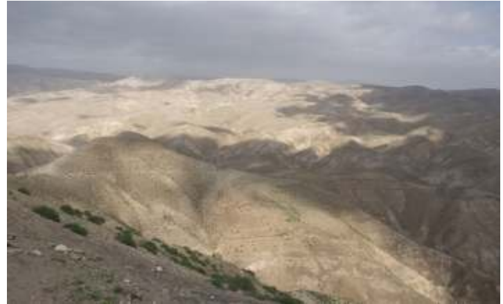
Pustynia Judycka.

Na pewno spotkałeś w życiu anioła. Kogoś, kto zauważył, że potrzebujesz pomocy i po prostu pomógł. Zupełnie się dla ciebie nie liczyło, czy to było coś ważnego, czy mało istotnego. Dobrze, że anioł pojawił się wtedy, kiedy było trzeba. Wiesz, że bez niego by się nie udało. Często tak jest, że inni potrzebują pomocy przeważnie nie w porę. Akurat wtedy, kiedy masz tyle swoich problemów na głowie, kiedy jesteś zmęczony, kiedy brak ci sił i ochoty. Pomóc wtedy czy nie? Pomyśl, co przyniesie ci więcej szczęścia.