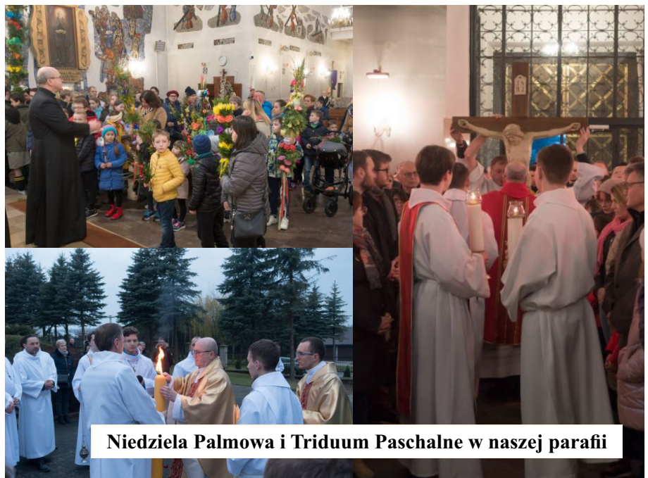
Niedziela Palmowa i Triduum Paschalne w naszej parafii

Pełnienie uczynków miłosierdzia: „Żądam od ciebie uczynków miłosierdzia, które mają wypływać z miłości ku Mnie. Miłosierdzie masz okazywać zawsze i wszędzie bliźnim, nie możesz się od tego usunąć, ani nie wymówić, ani uniewinnić. Podaję ci trzy sposoby czynienia miłosierdzia bliźnim: pierwszy - czyn, drugi - słowo, trzeci - modlitwa. W tych trzech stopniach zawiera się pełnia miłosierdzia i jest niezbitym dowodem miłości ku Mnie. W ten sposób dusza wystawia i oddaje cześć miłosierdziu Mojemu”. (Dz. nr 742).