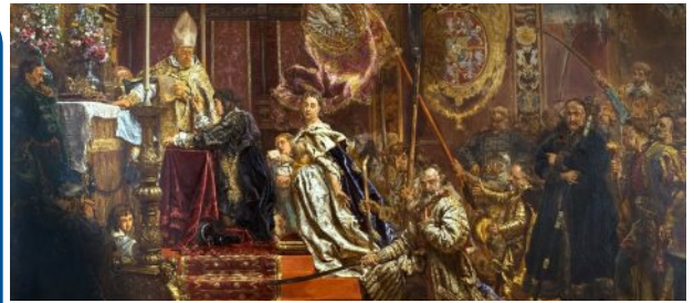
1 kwietnia 1656 roku król Jan II Kazimierz złożył we lwowskiej katedrze śluby, ogłaszając Matkę Bożą Królową Polski

Niedziela Palmowa, czyli Męki Pańskiej 29.03.2026