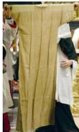
Suknia Matki Bożej