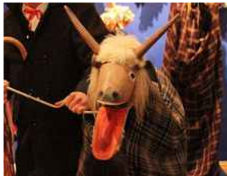
Fot. Koza z ruchomą paszczą.

W innych orszakach chodzili chłopcy ubrudzeni sadzą, umalowani i przebrani za baby z dzieckiem, dziada, Cygana i Cyganek, Żyda, Turka, diabła, śmierć, a czasem i żandarma. Niektórzy ubierali się w stroje charakterystyczne dla innej płci - mężczyźni zakładali suknie kobiece, a kobiety przebierały się za mężczyzn. W zwykłym czasie zmiana taka była nie do