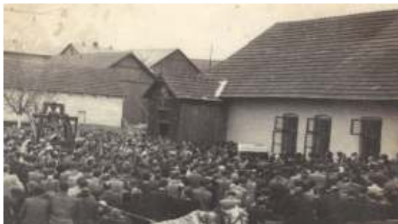
Parafianie przed tymczasową kaplicą w budynku remizy OSP (1954 r.)